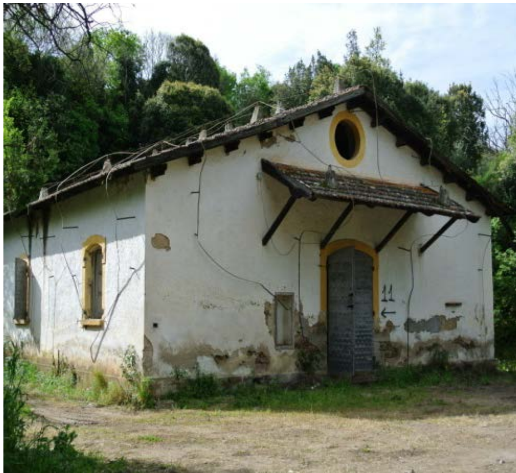
Località Listincheddu, Ozieri (SS)